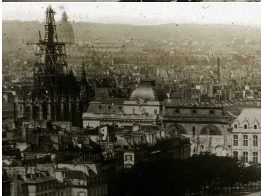
Paris - Ponts sur la Seine. Vue prise de l'église Saint Gervais. Photographie