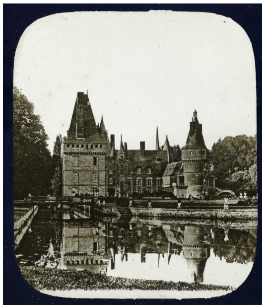
France. Château de Maintenon.