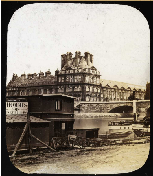
Paris - Les Tuileries et le pavillon de flore, vus du port de Solférino.

Paris - Tuileries Palace and Marsan Wing from the bank of Solférino.