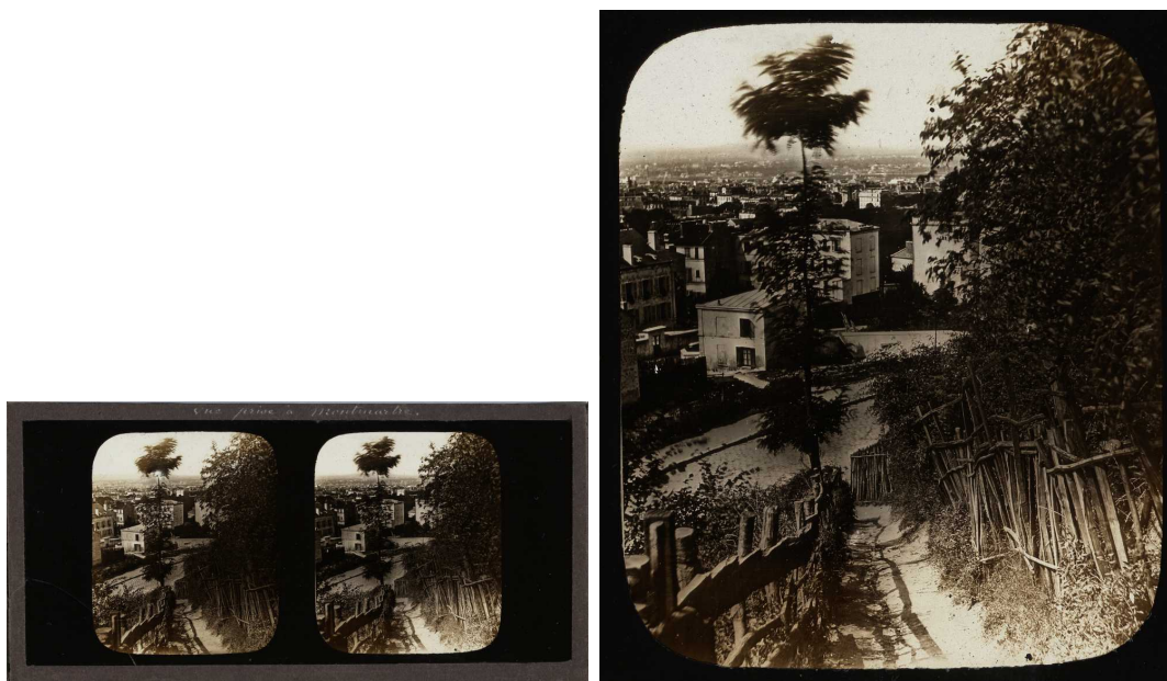
Montmartre. « Vue prise à Montmatre »