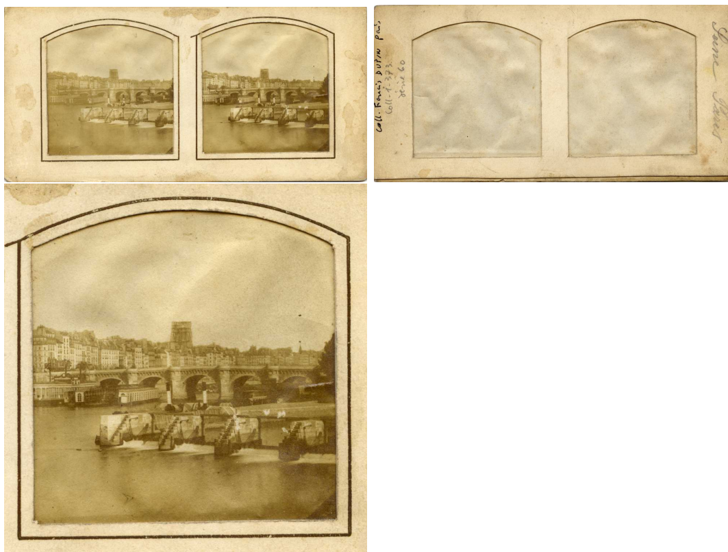
Paris- Ecluse du quai de conti, ou écluse de la Monnaie Paris - Bank of Conti

Au dos, légende au crayon : «Seine Paris» Papier salé Salted print