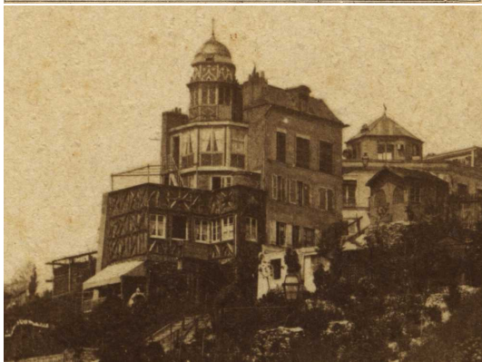
Montmartre. La rue des Trois Frères et le Pavillon du Bel air. Indexation sur stereotheque.fr Montmartre

”A gauche, verticalement dans l’encadrement : ””Montmartre”” au crayon.