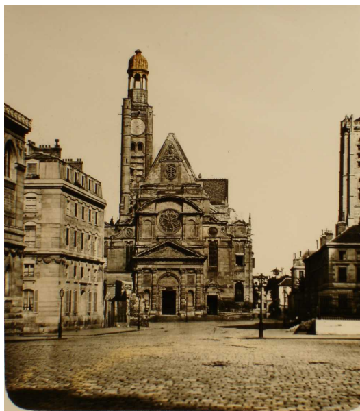
Paris - «9 St Etienne du Mont Paris. Par Clouzard et Soulier. Paris. Church Saint Etienne du Mont