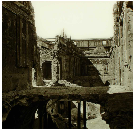
« 858. Intérieur des Tuileries, Paris en 1871 ». Lachenal & Favre. Paris, inside the castle of the Tuileries, in 1871.