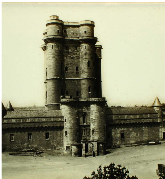
« L.F 913. Donjon du château de Vincennes, Paris. » Lachenal & Favre. Paris - Vincennes, the donjon

Figure dans le catalogue de Lachenal & Favre de 1872 et 1874, mais pas dans celui de 1871.