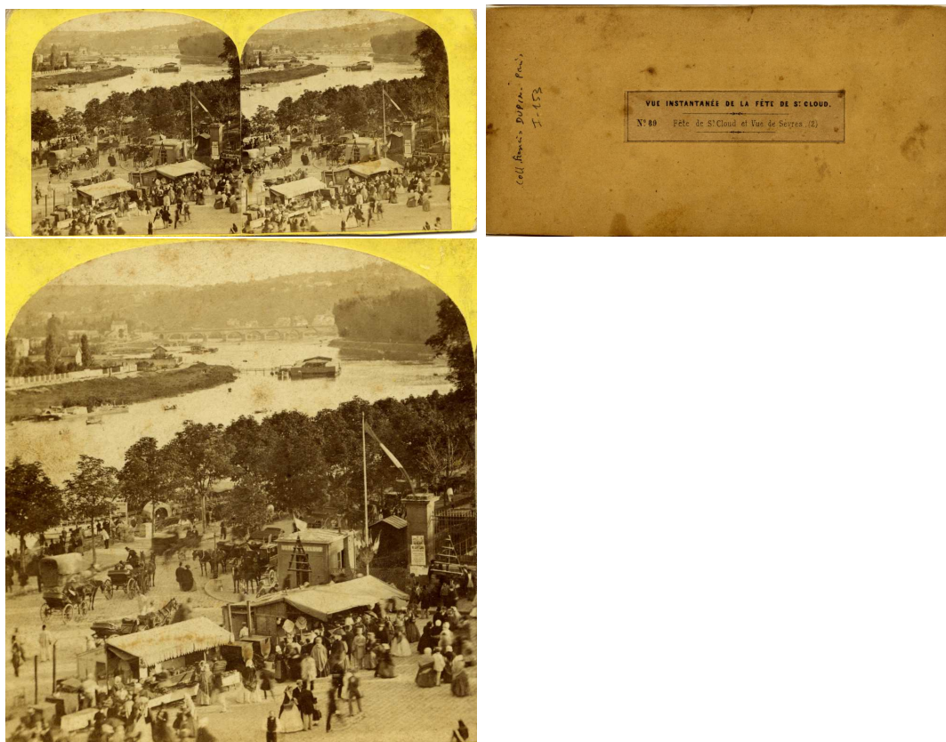
Saint-Cloud - « Vue instantanée de la fête de Saint Cloud. N° 89. Fête de Saint-Cloud et vue de Sèvres (2) ». Par Jouvin.