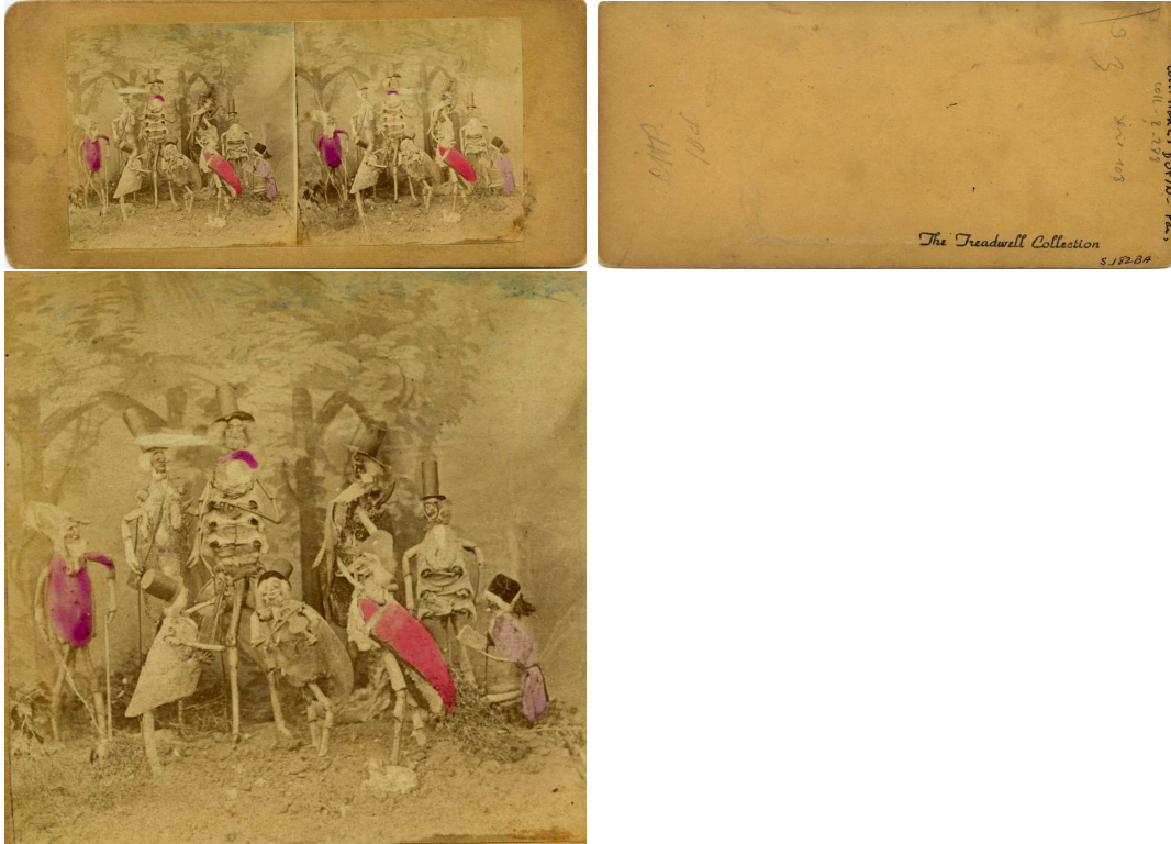
Crustacés humanisés humanized crustaceans