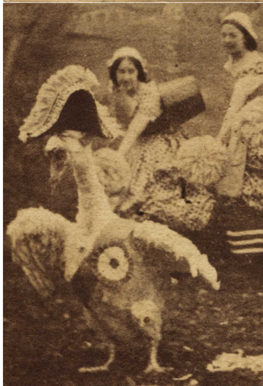
Vue satyrique. Tête de Napoléon III greffée sur une oie repoussée par des bonnes de ménage. Vue attribuée à Alfred Silvester.