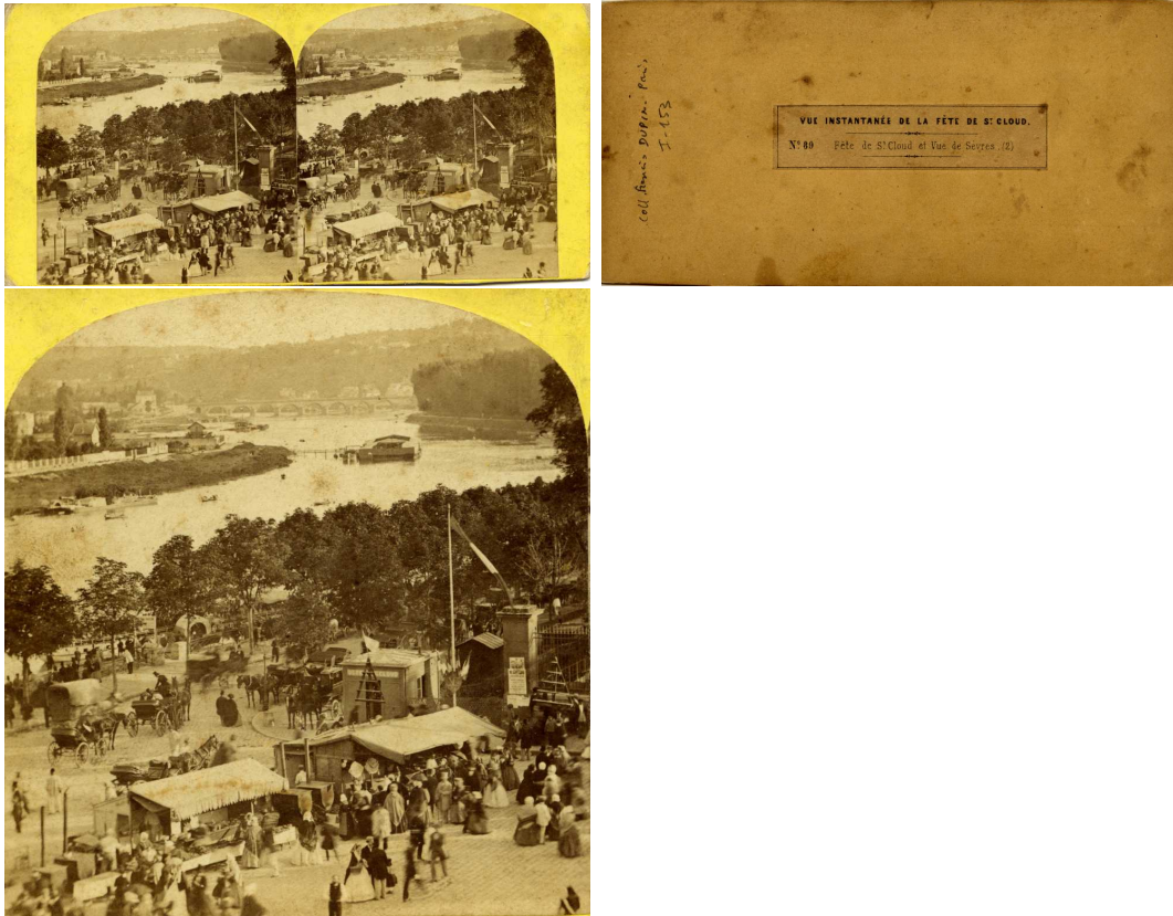
Saint-Cloud - « Vue instantanée de la fête de Saint Cloud. N° 89. Fête de Saint-Cloud et vue de Sèvres (2) ». Par Jouvin.