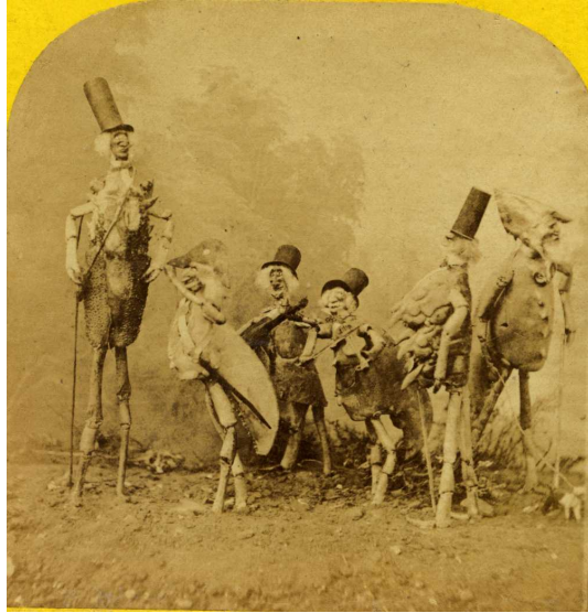
Crustacés humanisés humanized crustaceans