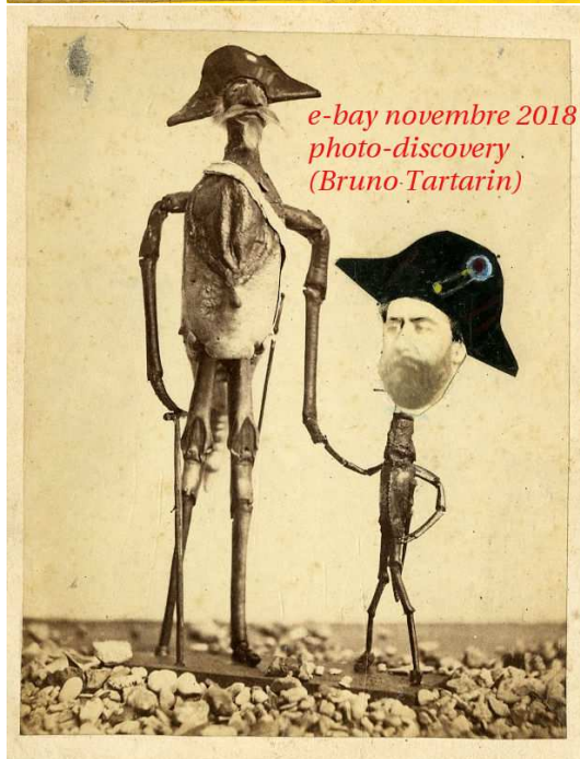
e-bay novembre 2018 photo-discovery (Bruno Tartarin)

Crustacés humanisés humanized crustaceans