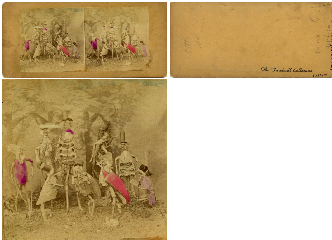
Crustacés humanisés humanized crustaceans