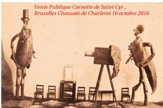
Vente Publique Cornette de Saint Cyr , Bruxelles Chaussée de Charleroi 16 octobre 2016